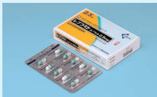
レブラミド® カプセル2.5mg (10カプセル×1シート)