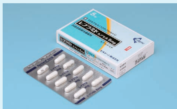
レブラミド® カプセル5mg (10カプセル×1シート)